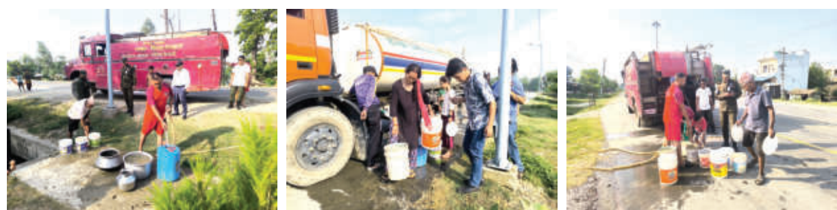
दीपक ओली / राजधानी धनगढी, १० असार

धनगढीसहित पश्चिम तराईका क्षेत्रमा भूमिगत पानीको सतह निरन्तर घट्टे जाँदा खानेपानी तथा सिंचाइ संकट गहिरिँदै गएको छ। मनसुन सक्रिय हुन नसक्दा लामो खडेरीको सामना गरिरहेका स्थानीयवासीले अहिले खानेपानी अभावसमेत भोग्न थालेका छन्। भूमिगत पानीको सतह घट्टेपछि अधिकांश हातेपम्प सुकेका छन् भने मकौला तथा डिप बोरिङमा आधारित सिंचाइ प्रणाली प्रभावित भएको छ। यसको प्रत्यक्ष असर किसानमा परेको छ। पर्याप्त सिंचाइ नपाउँदा धान रोपाइँ प्रभावित भएको छ भने वारीमा लगाइएका तरकारीवासीसमेत सुक्न थालेका छन्।