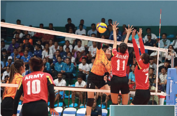
राजधानी समाचारदाता काठमाडौं

फिजियन आर्मी क्लब र सशस्त्र प्रहरी बलको एपीएफ क्लब माल्टी प्रदानमनी कप एपीएफ महिला तथा पुरुष राष्ट्रिय शिबिरको उदघाटन २०८० मा तयारार दौडो जित निकाले अर्क लोचकमा समाप्त ५५ अर्कका साथ शीर्ष स्थानमा उत्र्न सफल भएका छन्। आर्मीले दोस्रो दिन दोस्रो जित निकाल्ने क्रममा सार्वाभौमिक प्रथम अर्कलाई २-१९, २५-१९, २५-२० अर्कले पराजित गर्दै ३ अर्क जितेको हो। पहिलो सेट २१-२५ ले समाप्त भएको थियो। दोस्रो सेटमा आर्मीले २१-२५ ले समाप्त भएको थियो। पहिलो सेट २१-२५ ले समाप्त भएको थियो। पहिलो सेट २१-२५ ले समाप्त भएको थियो। पहिलो सेट २१-२५ ले समाप्त भएको थियो।