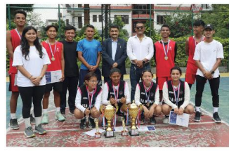
राजधानी समाचारदाता काठमाडौं

मनास्लु बल्ले कलेज र आर्सीए नेपालले गोलिन्टो इन्टरनेसनल कलेज एमईई कप प्री बाइ प्री बास्केटबल प्रतियोगिता उपाधि जितेको छ। मनास्लु ब्याडमिन्टन तथा आर्सीए गेम्समा च्याम्पियन बने। बर्सेलपुर्नसित आयोजक गोलिन्टो इन्टरनेसनल कलेजको कोर्टमा आइतबार सम्पन्न फिजियनमा मनास्लुले जाल्दलाई २०-१९ ले पराजित गर्‍यो। गोलिन्टो इन्टरनेसनल कलेजको कोर्टमा आइतबार सम्पन्न फिजियनमा मनास्लुले जाल्दलाई २०-१९ ले पराजित गर्‍यो।