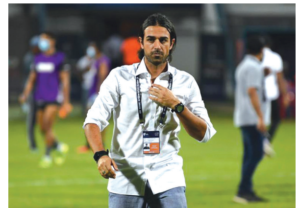
राजधानी समाचारदाता काठमाडौं