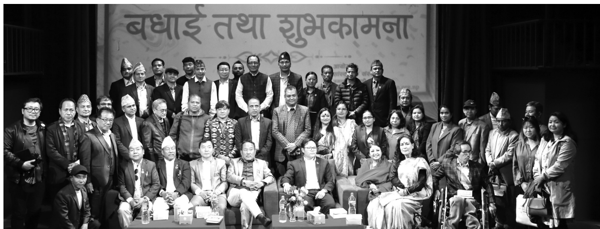
राजधानी समाचारदाता काठमाडौं

नेपाल प्रजा प्रतिष्ठान, नेपाल ललितकला प्रजा प्रतिष्ठान र नेपाल संगीत तथा नाट्य प्रजा प्रतिष्ठानका नवनिर्वात कुलपतिले विगतभन्दा केही फरक र जनमुखी काम गर्ने प्रतिबद्धता जहेर गरेका छन्। सांस्कृतिक संस्थान राष्ट्रिय नाचघरले आयोजना गरेको प्रतिष्ठानका पदाधिकारी एवं सदस्यलाई बधाई तथा शुभकामना प्रदान कार्यक्रममा उनीहरूले राम्रो काम नगरे पदबाट आफूहरू राजीनामा दिन पछि नपर्ने जिकिर गरेका छन्।