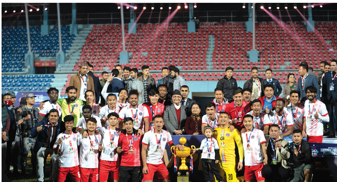
राजधानी समाचारदाता काठमाडौं

लगातार दुई पटकको लिंग च्याम्पियन मछिन्द्र फुटबल क्लब पहिलो संस्करणको केपी ओली कप राष्ट्रिय फुटबल च्याम्पियनसिपको च्याम्पियन बनेको छ। त्रिपुरेश्वरस्थित दशरथ रंगशालामा बुधवार भएको फाइनलमा सातदोबाटो युव क्लबलाई पेनाल्टी सुट आउटमा ५-३ ले पराजित गर्दै च्याम्पियन बन्न सफल भएको हो। लगातार दोस्रो दिन दुई फाइनल