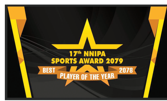
राजधानी समाचारदाता काठमाडौं

नेपाल राष्ट्रिय तथा अन्तर राष्ट्रिय खेलाडी संघ (एनएनआईपीए) को आयोजनामा चैत तेस्रो साता १७औं एनएनआईपीए स्पोर्ट्स अवार्ड आयोजना हुने भएको छ। आयोजक एनएनआईपीएले बुधवार प्रेस विज्ञापित जारी गर्दै १७औं एनएनआईपीए स्पोर्ट्स अवार्ड चैत १७ गते हुने जानकारी गराएको छ। वर्ष २०७८ मा राष्ट्रिय तथा अन्तर्राष्ट्रियस्तरका अफिसियल खेलकुद प्रतियोगिता नभएको हुदा यस वर्ष नेपाल ओलम्पिक कमिटीबाट आधिकारिकता प्राप्त २७ खेललाई आधार मानी सम्बन्धित संघले सिफारिस गरिएका खेलाडीलाई सम्मान गर्ने एनएनआईपीएले जनाएको छ। विगतका केही वर्षदेखि यो अवार्ड कार्यक्रम उपत्यकाको काठमाडौं, ललितपुर तथा भक्तपुरलगायतका विभिन्न ऐतिहासिक, सांस्कृतिक सहरमा आयोजना भइसकेकोमा यसपटक काठमाडौंमा हुने आयोजकले जनाएको छ। २७ खेलका उत्कृष्ट खेलाडीलाई १० हजार रुपैयाँ प्रदान गरिनेछ। २७ उत्कृष्ट खेलाडीमध्येबाट एक जना पुरुष