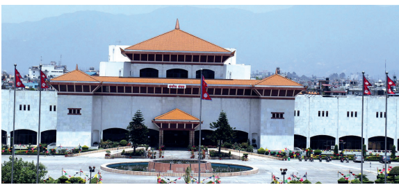
राजधानी समाचारदाता काठमाडौं

उपराष्ट्रपति निर्वाचनपछि मात्रै प्रतिनिधिसभा बैठक बस्नेगरी स्थगित भएको छ। सूचनामा उल्लेख भएअनुसार अब ५ चैतमा प्रतिनिधिसभा बैठक बस्ने छ। आगामी २५ फागुनमा राष्ट्रपति तथा ३ चैतमा उपराष्ट्रपति निर्वाचन तोकिएको छ। दुवै निर्वाचनमा प्रतिनिधिसभा, राष्ट्रियसभा र प्रदेशसभा सदस्य मतदाता हुने छन्।