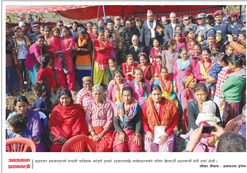
जनतामाझ प्रधानमन्त्री | आइतबार मकवानपुरको मन्थली गाविसमा भोलुपुंगे पुगेको उद्घाटनपछि सर्वसाधारणसँग तस्बिर खिचाउँदै प्रधानमन्त्री केपी शर्मा ओली ।

काठमाडौं | वर्ष १४, अंक २०८, काठमाडौं सोमबार २० पुस २०७२, नेपाल संवत् १९३६ | Email: rajdhaninews@gmail.com | RAJDHANI Nepali National Daily | Kathmandu, Monday 4 January 2016 | पृष्ठ : ८ मूल्य रु. ४/-