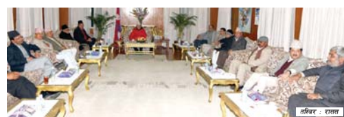
राजधानी समाचारदाता काठमाडौं, १९ पुस