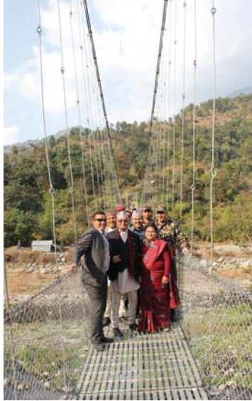
पुल निर्माण गरेर नागरिकलाई सुविधा दिइएको बताए।

देशभरका तुरुन्तै टाढा आवजवात गर्ने पक्षीको विस्थापित गर्ने बताएका उनले आगामी दुई वर्षमा कुनै पनि नेपालीले तुरुन्तै टाढा आवजवात गर्न नपर्ने दावी गरे।