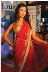
राजधानी समाचारदाता काठमाडौं, ११ पस

ढल्कंदो सांभलाई चिदै जब न्याम्पमा प्रकाश पोखियो । तब सारीमा सजिएर युवतीहरू न्याम्पमा उत्रिए । पुसको चिसोलाई उनीहरूको क्याटवाकले चुनौती दिदै थियो । कार्यक्रम स्थलमा दर्शकको घुइँचो त्यत्तिकै बढेको थियो ।