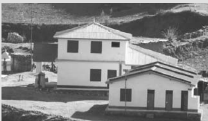
इलाका प्रहरी कार्यालय दिने पाँचकोटिकाको नवनिर्मित भवन।

‘सरकारले शान्तिका लागि पुर्णनिर्माण अभियान’ भन्ने नारासहित जाजरकोटमा पहिलो चरणको १ करोड ६ लाख ८८ हजार रूपैयाँ लागतमा पाँचकोटिका, सडकबन र दोस्रो चरणको ७३ लाख ३१ हजार रूपैयाँ लागतमा पञ्चाला दहको भवन निर्माण भएको छ। तेस्रो चरणको ७८ लाख ७४ हजार रूपैयाँ लागतमा दली इलाका प्रहरी कार्यालय भवन निर्माणको चरणमा छ।