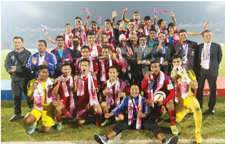
रामसुदन निमर्सिना / राजधानी मुम्बारी, ३ फागुन

नेपाली फुटबल टिमले २३ वर्षपछि दक्षिण एसियाली खेलकुदमा स्वर्ण पदक जितेको छ । सन् १९९३ को इतिहास बोहोन्दाउँदै फाइनलमा भारतलाई पराजित गर्दै नेपालले उपाधि चुम्नेको हो ।