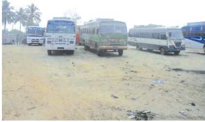
आन्दोलनका कारण रोकिएका लामो दूरीका सवारीसाधन ।