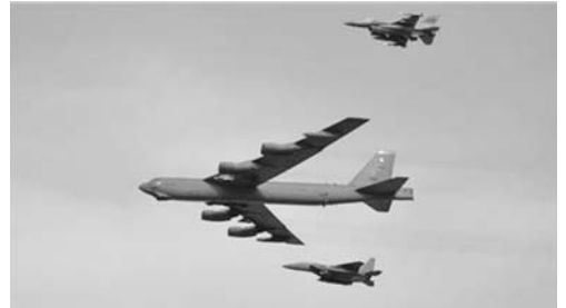
एजेन्सी सीए, २६ पुष

उत्तर कोरियाले हाइड्रोजन सफलताका साथ परीक्षण गरेको घोषणासँगै दक्षिण कोरियासँगै तनाव बढिरहेका बेला अमेरिकी लडाकु विमान दक्षिण कोरियाको आकाशमा उडेको छ ।