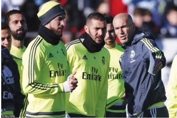
रियलको प्रशिक्षकको जिम्मेवारी सम्हालेपछि टिमलाई अभ्यास गराउँदै जिदानले जिवान।

यद्यपि उनलाई सात महिना नबित्दै बर्खास्त गरिएको छ। स्पेनिस ला लिगामा म्यालेसियासँग २-२ को बराबरीमा रोसिएन्स विरुद्धको बोरडो बेनिटेजलाई बर्खास्त गर्ने निर्णय गरेको हो। त्योभन्दा पनि उसले आफ्नो चिरपरिचित फुटबल डायरेक्शनलाई फर्काउनुको सट्टामा नै भएको खेलमा ४-० को हार बेनिटेजलाई अडिक्का समर्थक बेनिटेजको विरोधमा रहेका थिए भने। धेरै उन्लाई हटाउनुपुनर् नै राम्रोको थियो। बेनिटेजको प्रशिक्षणमा रियलले लिगमा १८ खेल खेल्दा ११ खेलमा जित निकाल्न सफल भएका थिए भने ४ खेल बाबारी ३ खेलमा हार बेनिटेजको थियो। जसमा म्यालेसिया विरुद्ध २-० र रायो