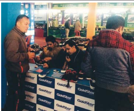
राजधानीको भुट्टीमण्डपमा सञ्चालित कुट र सुटको मेसामा स्वदेशी जुता खरिद गर्दै विपन्न वर्तारोही तस्विर : राधाधानी

गत २८ असारदेखि यो परियोजना कार्यान्वयनमा ल्याएको थियो। परियो जनामार्फत घाँडेले पशु धनको उधार गरी उपचार तथा पुनःस्थापना कार्यक्रम आयोजना गरिएको थियो। यस्तैगरी मरेका पशुजनालाई मुरीगत रूपमा व्यवस्थापन गरिएको थियो। घुस्र एउटा र हेक्टर इन्टरनेसनलले परियोजनाका लागि ९ करोड ४८ लाख रुपैयाँ उपलब्ध गराएको थियो।