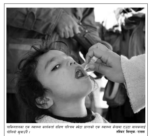
पाकिस्तानका एक स्वास्थ्य कार्यकर्ता दक्षिण पश्चिम केनटा प्रान्तको एक स्वास्थ्य केन्द्रमा एउटा बालकलाई पोलियो बुझाउँदै।

आन्दोलनको व्यापक रूप लिन चलेपछि प्रान्तीय राज्यका अधिकारीले अर्धसैनिक बल प्रयोग गरेर भए पनि स्थितिलाई नियन्त्रणमा लिन दिदेशन दिएपछि सुरक्षाकर्मीले आन्दोलनविरुद्ध बल प्रयोग गरेको हो।