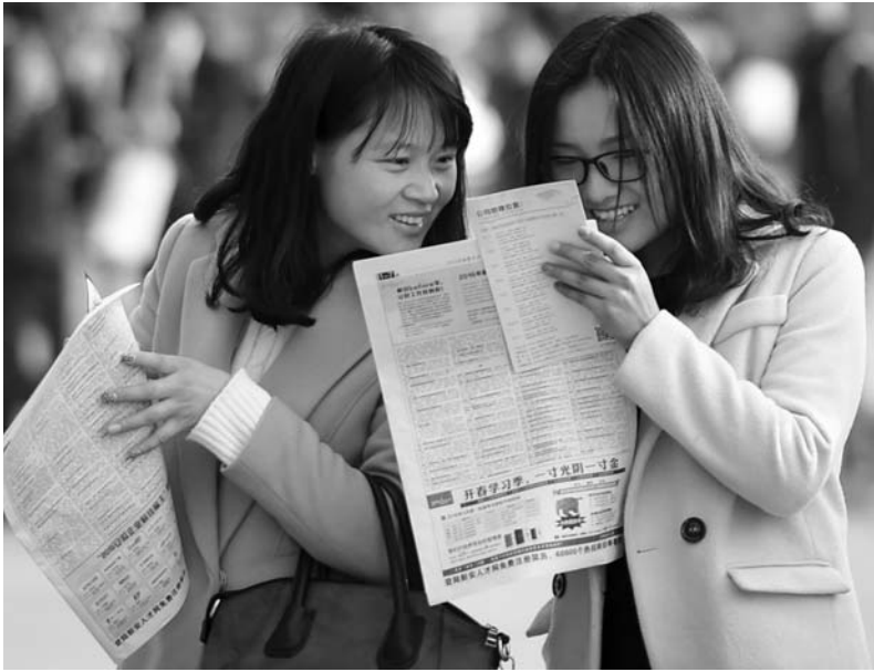
चीनको पूर्वी प्रान्त अन्हुईमा आयोजित रोजगार मेलामा शनिबार रोजगारी खोजीमा रहेका युवतीहरू सहभागी हुँदै। सो मेलाका ८ सय व्यापारीहरूले १० हजार बेरोजगारलाई जागिर प्रदान गरेका छन्।