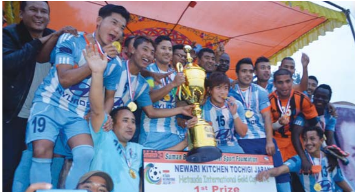
धुव अधिकारी/राजधानी हेटौडा, ८ फागुन

हेटौडाका पहिलो पटक आयोजना भएको कलेस अन्तर्राष्ट्रिय गोल्ड कपको उपाधि मनाङ मस्याङ्दी क्लबले जितेको छ । १६औँ संस्करणको आहा गारा गोल्डकपको उपाधि यात्रालाई कायम राख्दै बलियो प्रतिस्पर्धी नेपाल आर्मीलाई मनाङले पाखा लगाएको हो ।